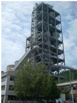
Bild 5: Neuer Wärmetauscherturm im Zementwerk Salanit Anhovo/Slowenien